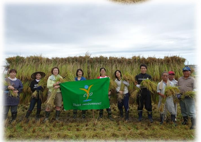
*こちらの画像は2018年活動時の撮影画像です